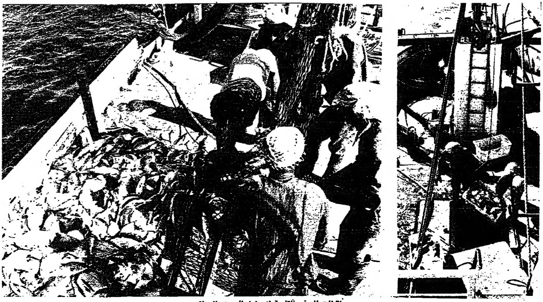
لقطات للسفن التابعة لإسطول الصيد العماني